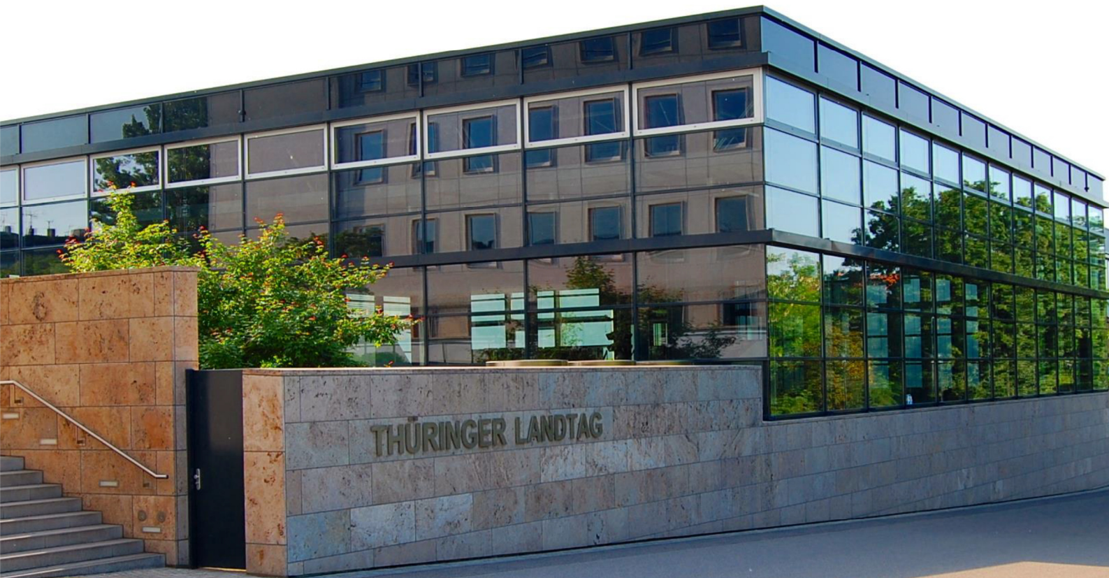
LZT Noua cameră plenară (din 2003) a Parlamentului turingian în Erfurt.