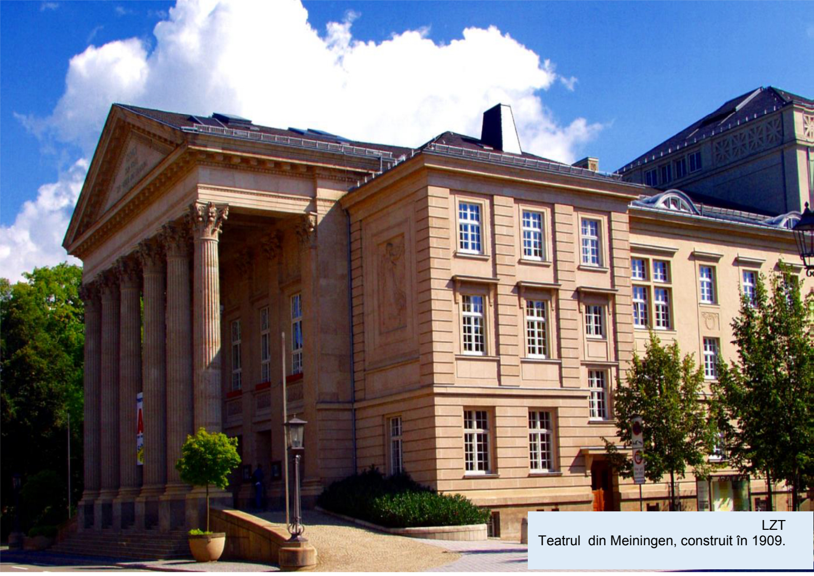
LZT Teatrul din Meiningen, construit în 1909.