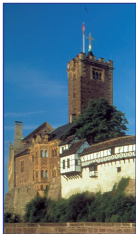
艾森那赫的瓦特堡

一览图林根州的历史，众多特征将它冠以“德国文化心脏之地”，“宗教改革中心”，“巴赫的故乡”以及“古典文艺之地”之称。有着丰富传统文化氛围的瓦特堡 (Wartburg) 和魏玛 (Weimar) 地区不但直到20世纪尚未成为统一的地区，恰恰相反的是，该地区是德国众多小国割据的典范。这种情况使得19世纪历史编纂学者在一方面表明图林根州对国家教育的强调推进了文化的发展的同时，另一方面也对这种四分