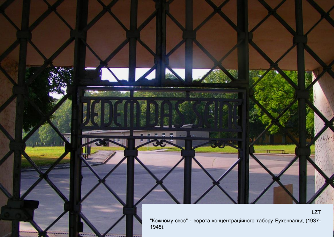
"Кожному своє" - ворота концентраційного табору Бухенвальд (1937-1945).