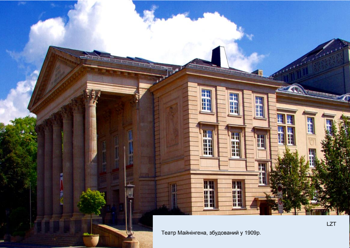
Театр Майнінгена, збудований у 1909р.