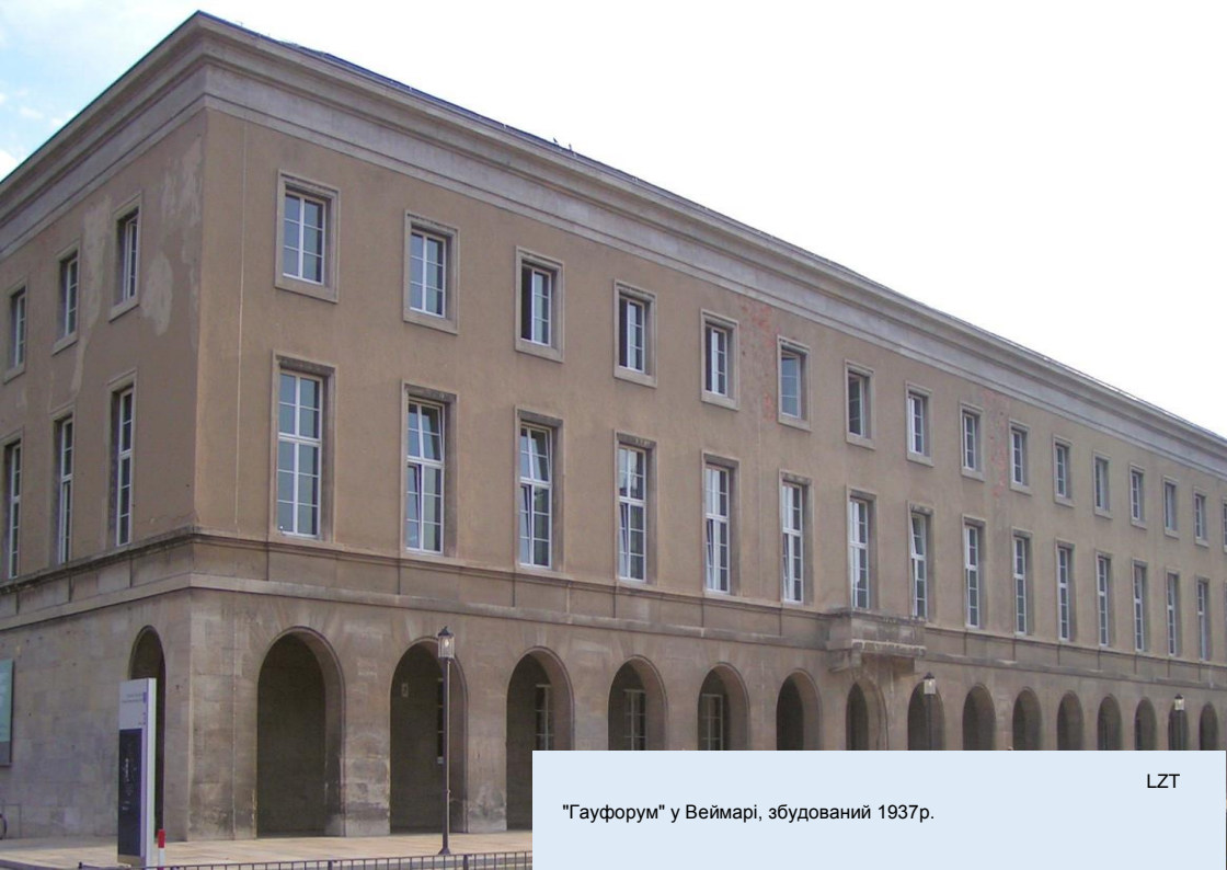
"Гауфорум" у Веймарі, збудований 1937р.