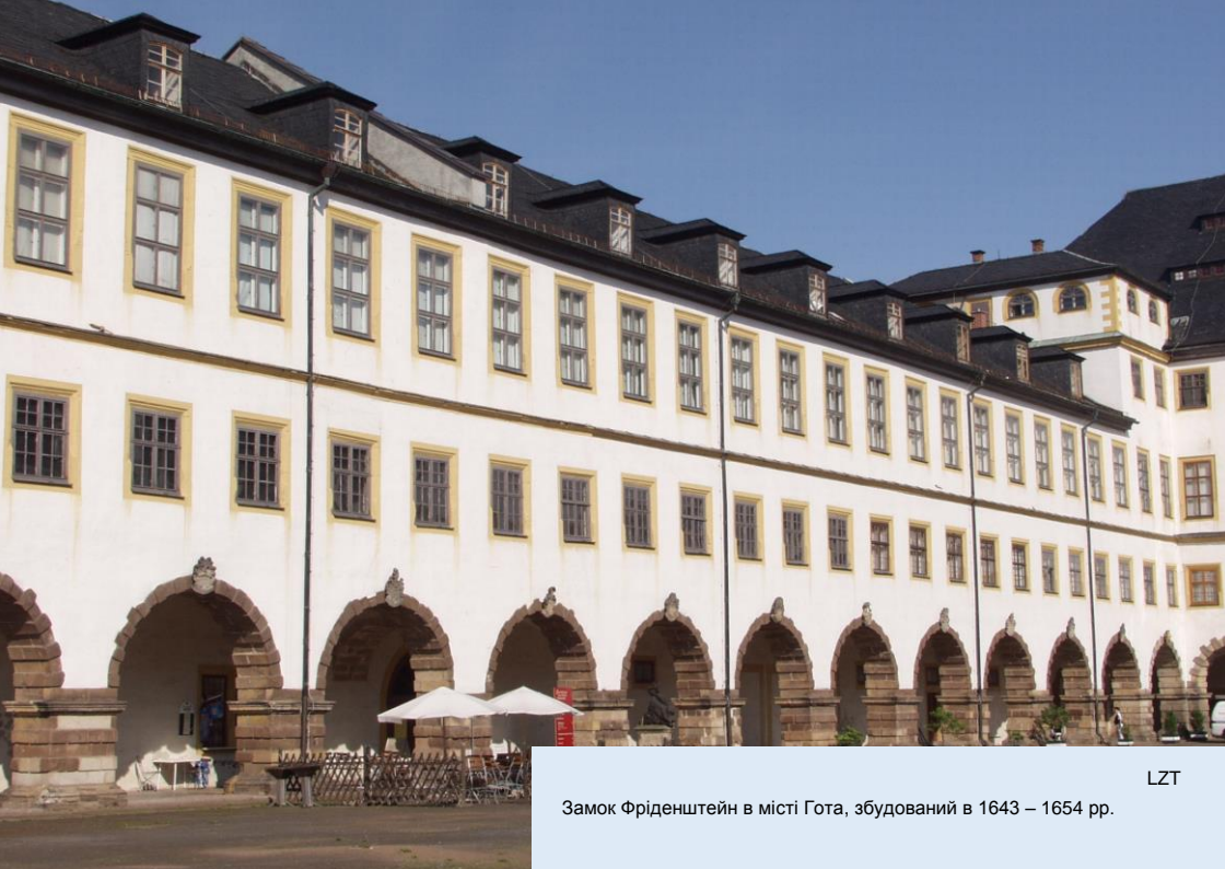
Замок Фріденштейн в місті Гота, збудований в 1643 – 1654 рр.