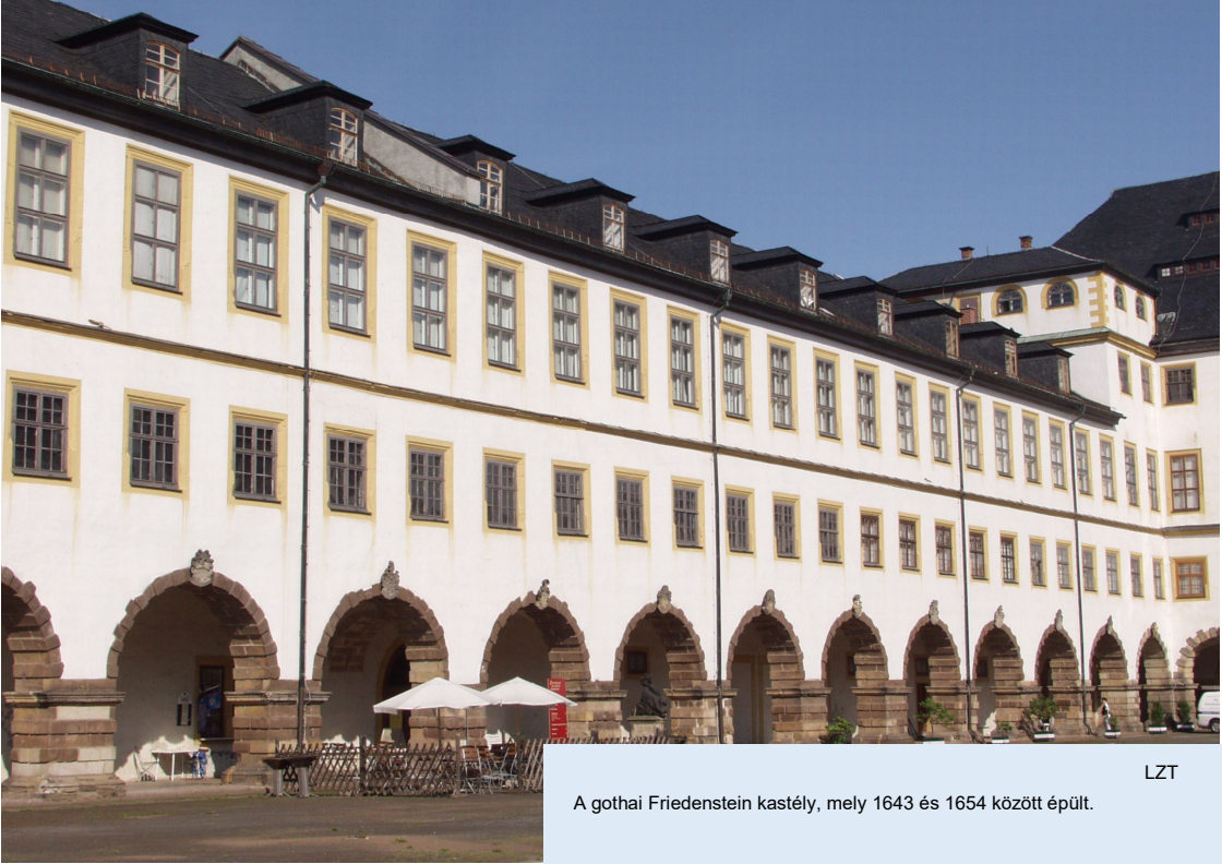
A gothai Friedenstein kastély, mely 1643 és 1654 között épült.