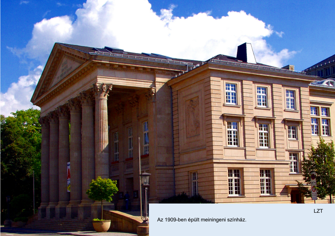
Az 1909-ben épült meiningeni színház.