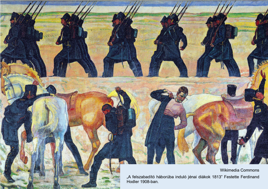
„A felszabadító háborúba induló jénai diákok 1813” Festette Ferdinand Hodler 1908-ban.