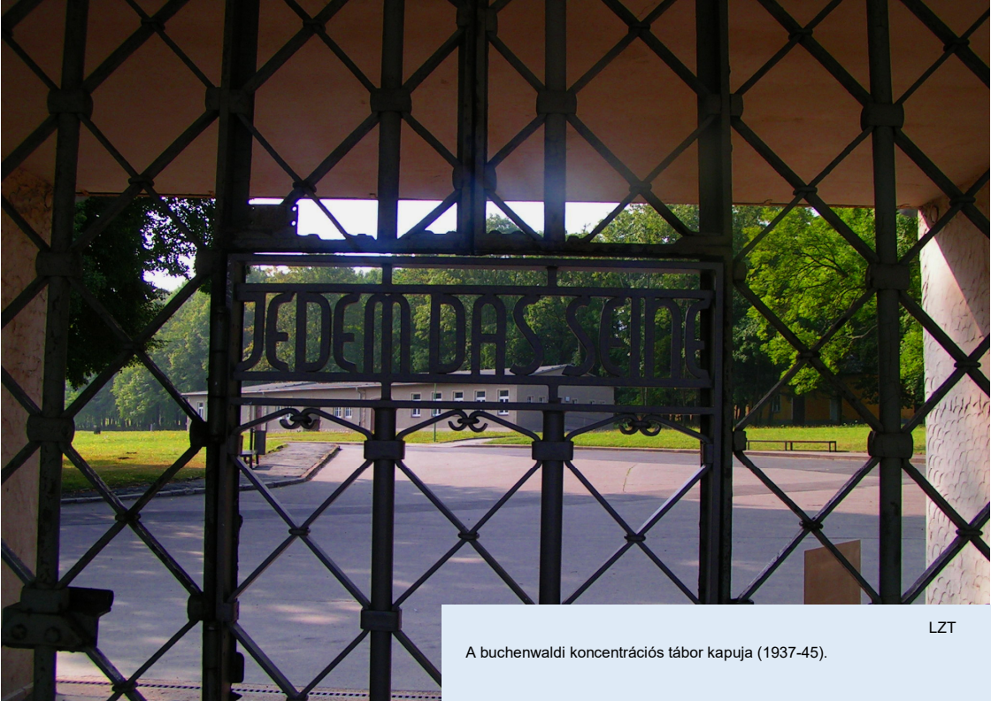
A buchenwaldi koncentrációs tábor kapuja (1937-45).