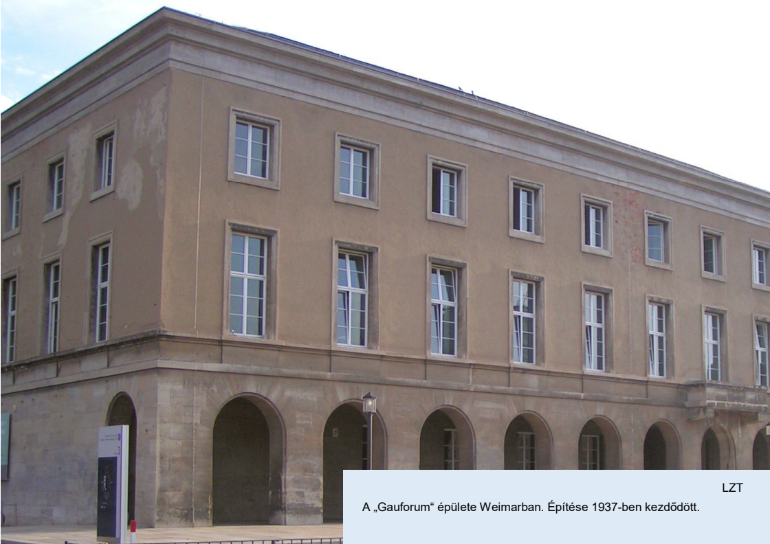
A „Gauforum“ épülete Weimarban. Építése 1937-ben kezdődött.