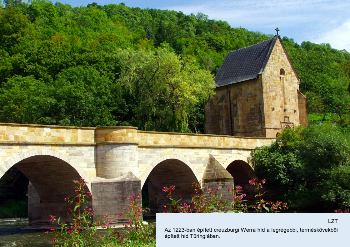
Az 1223-ban épített creuzburgi Werra híd a legrégebbi, terméskövekből épített híd Tübingiában.